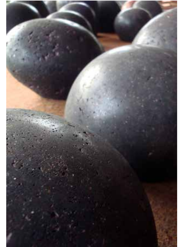
Claudi Casanovas, Jardí Imaginari , 2014. Gres, 20 x 20 cm.

En 1988 entra en contacto con la que será su galería de referencia a lo largo de los años, la Galería Besson de Londres, donde ha expuesto de forma bianual hasta 2011.