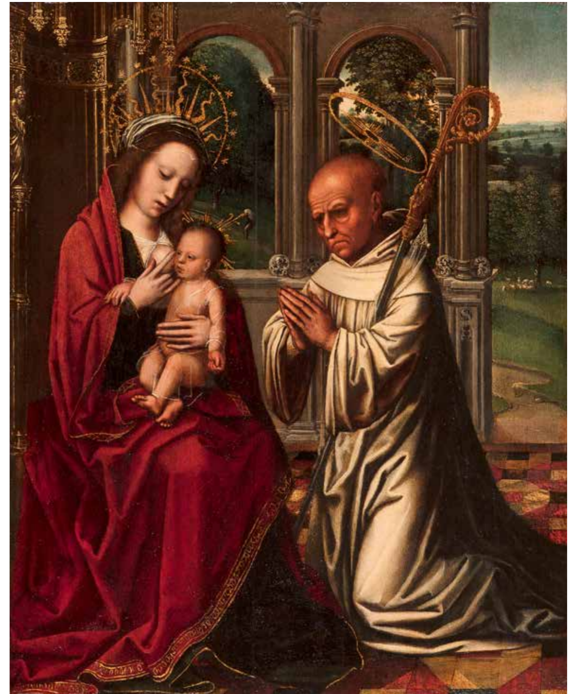
Adriaen Isenbrandt, Virgen con niño y San Bernardo de Claraval , c. 1530-1540. Óleo sobre tabla, 55 x 44 cm.