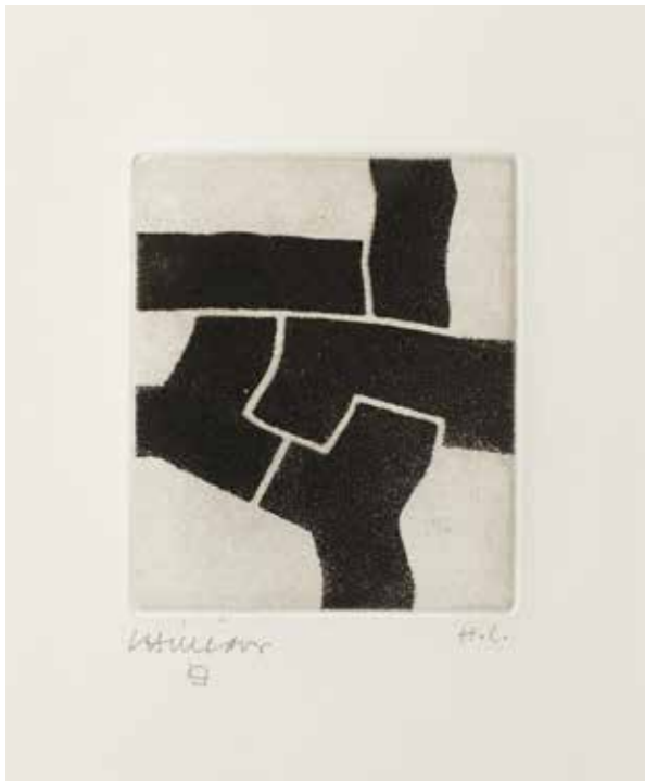
Eduardo Chillida, Zapatu (Prensar) , 1972. Aguatinta sobre papel Japón collé sobre Arches. P. 11 x 9,3 cm. Pp. 57,5 x 50 cm.

Es un artista inquieto, creador de sus propios hornos para cocer y neveras para congelar con tal de