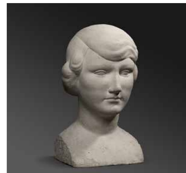
Enric Casanovas, Busto femenino , c. 1930. Piedra, 39 x 25 x 25 cm.

Durante el 2013, el período del cual partimos en esta exposición, en su obra hay una reaparición del tema antropomorfo del ojo y la cabeza. Creadas en las series Luna nueva , Pomones , Las Calladas , Jardín imaginario y Cuarto Creciente , el ceramista se inspira en obras de otros artistas como El Jardín del Salón , realizado por Llorens i Artigas (algunas piezas suyas estarán presentes en la galería) en colabora-