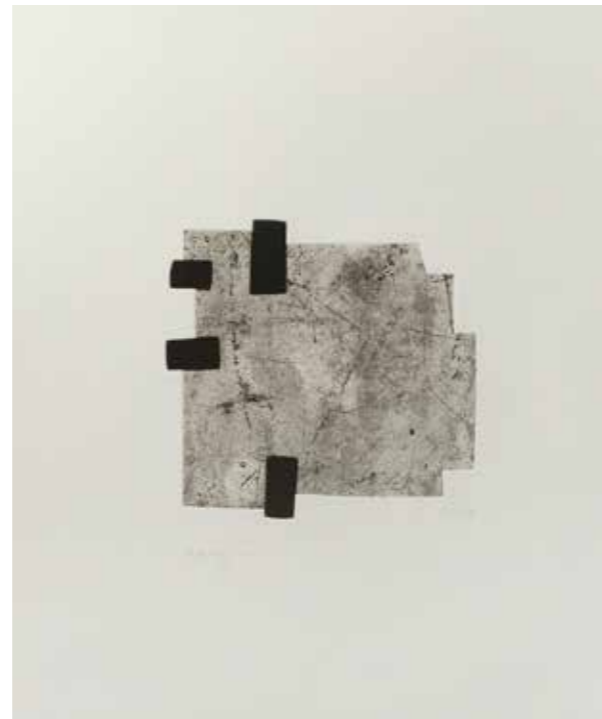
Eduardo Chillida, Saturn , 1994. Aguafuerte y aguatinta. Ejemplar 7/75. Pp. 65 x 50 cm. P. 21,1 x 22 cm.