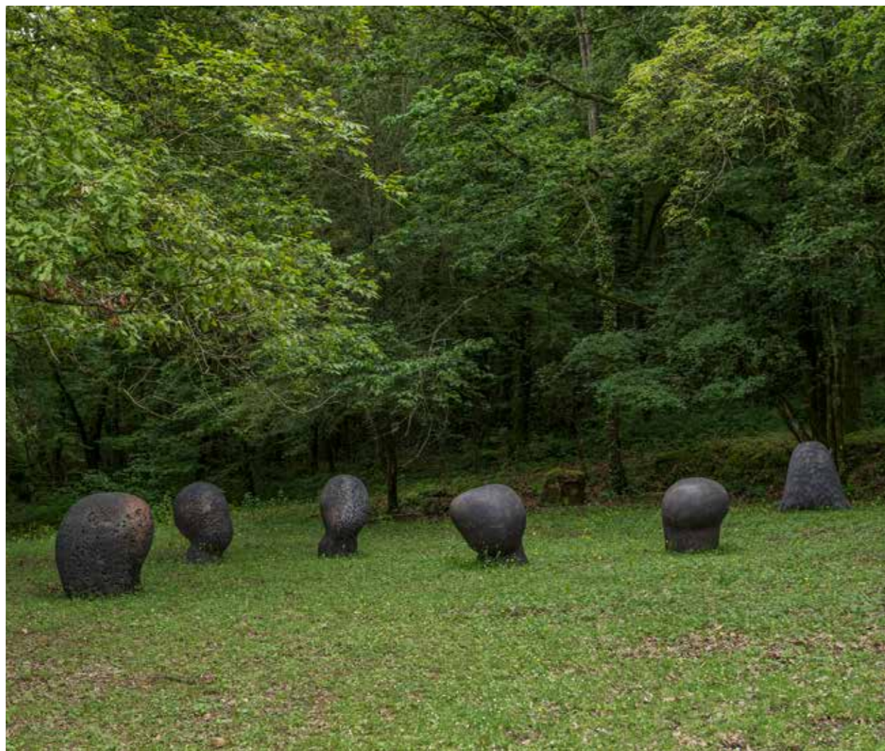
Claudi Casanovas. Pomones y Luna Nova . 2013. Gres. 86 cm diámetro, 90 cm alt.

El Arte es lo que queda al final de cada etapa del camino, nunca depende de nosotros.