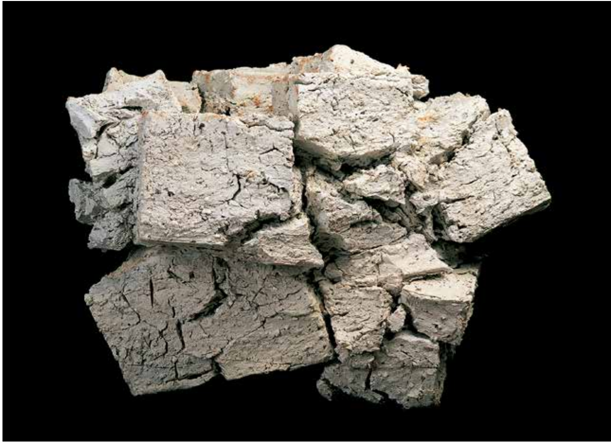
Claudi Casanovas, Salina , Serie Blocs , 2002. Gres. 93 x 106 x 141 cm.

Dos obras de la serie Pomonas (2013) forman parte de la exposición. Vinculadas a las diosas de la fecundidad y de la maduración de la fruta, Juno la deidad romana, Isis la deidad egipcia. Fecundidad, crecimiento, embrión y maternidad, son temas que también fueron trabajados por su abuelo paterno, Enric Casanovas.