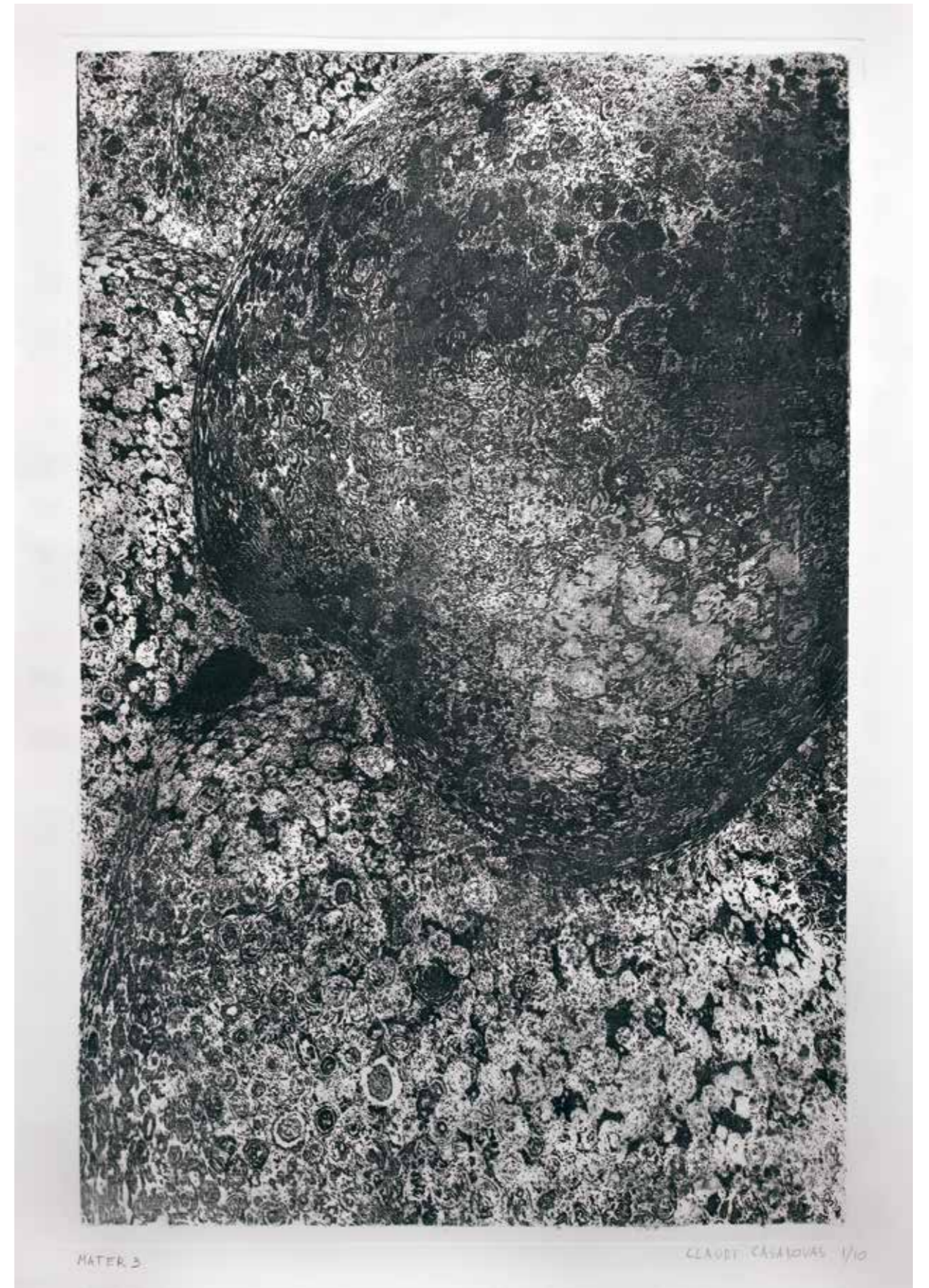
Claudi Casanovas, Mater III , 2023. Aguafuerte, 177 x 117 cm.