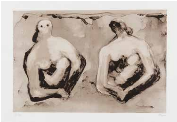
Henry Moore, Sisters with children , 1979. Litografía en colores, papel TH Saunders. Prueba de artista XV/XV. P. 33,3 x 49,8 cm. Pp. 56,2 x 74,5 cm.