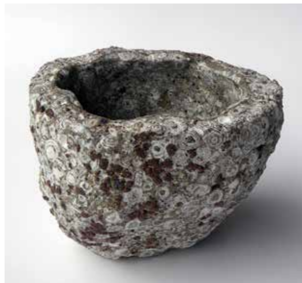
Claudi Casanovas, Oracle , 2020. Gres, 10 cm alt.

El mundo tangible, como la mancha, la huella, la porosidad, la negrura, el grattage y un contenido más simbólico como el embrión, el crecimiento, el origen, la Virgen y la maternidad, es el puente entre la selección de piezas de la galería Artur Ramon Art y el trabajo de Claudi Casanovas presente en esta exposición.