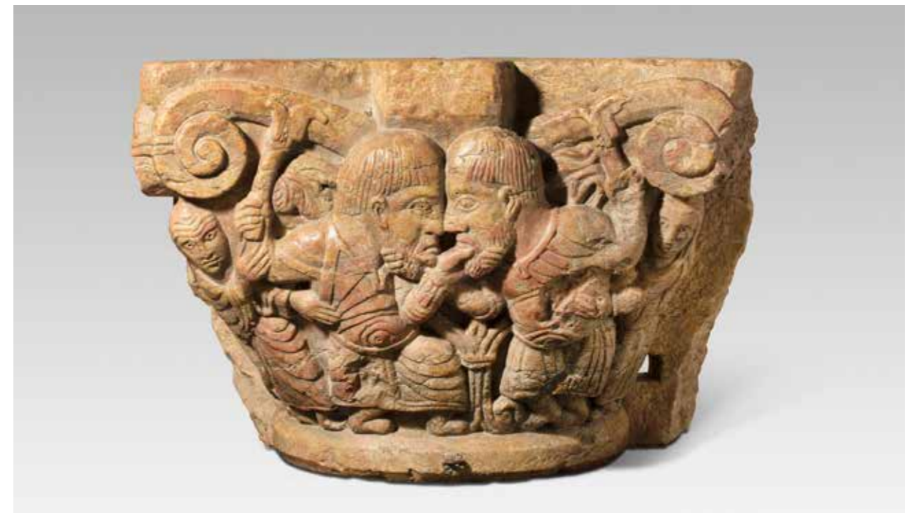
Capitel “La disputa”, Rossellón, S. XIX. Mármol rosa, 40 x 59 x 36 cm.