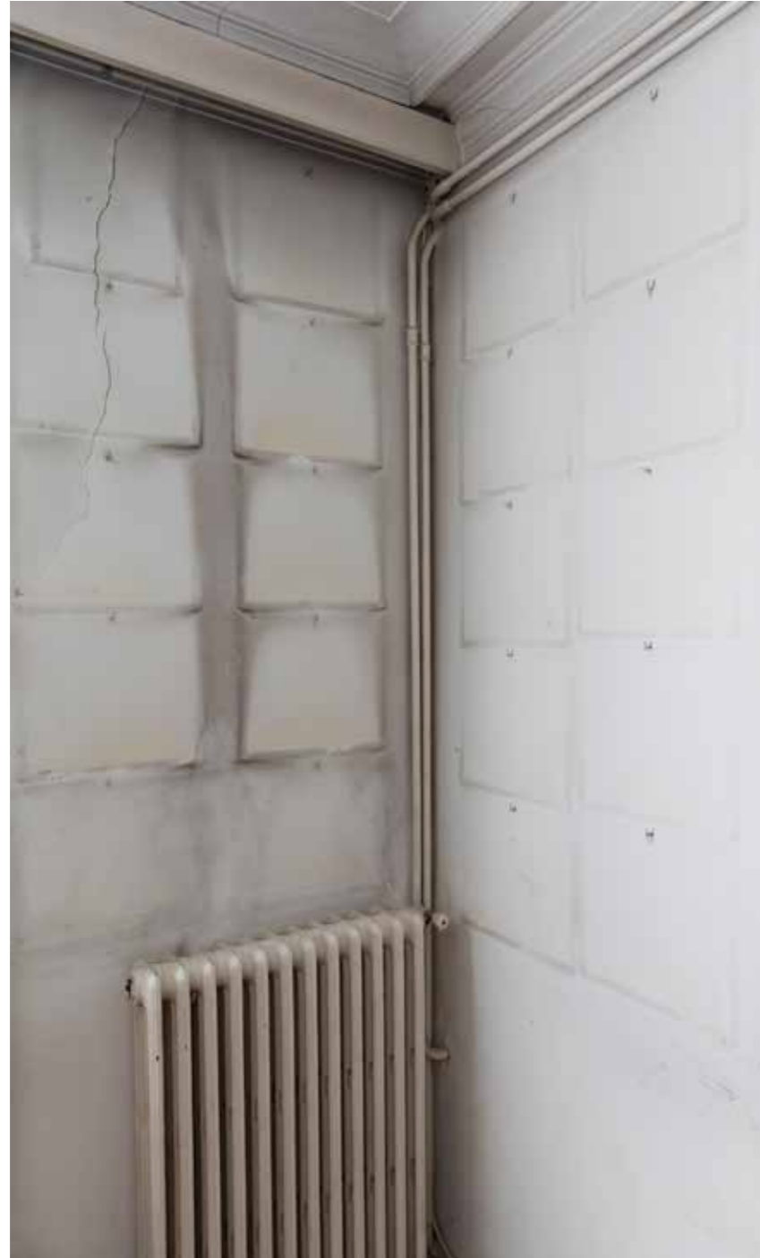
Provença, 292. Paper Giclée Photo Rag baryta montat en Forex / Giclée Photo Rag baryta paper mounted on Forex, 100 x 66,6 cm.