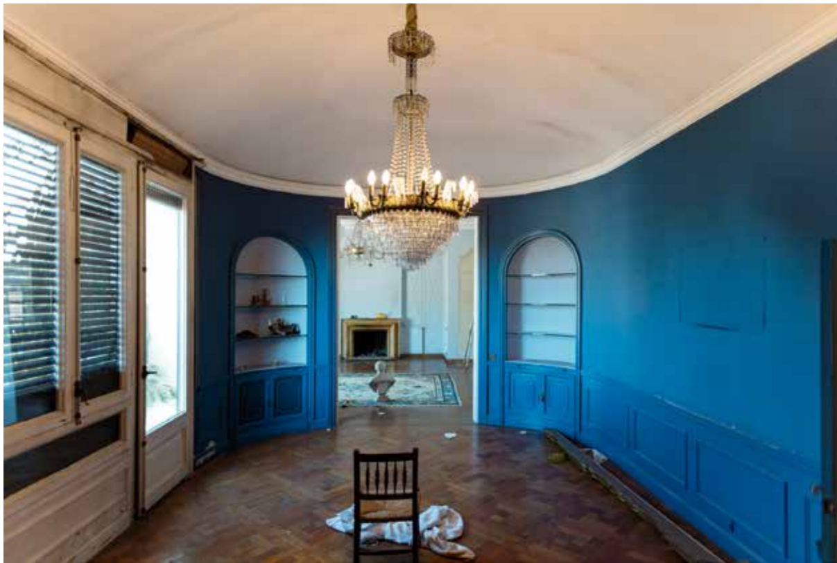
Rambla Catalunya, 43. Paper Giclée Photo Rag baryta montat en Forex / Giclée Photo Rag baryta paper mounted on Forex, 100 x 66,6 cm.

L'autor, exercint com un arqueòleg d'interiors, fa uns vint anys que documenta fotogràficament tots aquests pisos de la ciutat de Barcelona amb el propòsit de rescatar-los instants abans de la seva desaparició. Paisatges efímers i moltes vegades desoladors, records personals per terra, roba, llibres, documents... i en aquests instants de canvi, de moviment, és quan es fan aquestes fotografies. Sense gaire temps, mentre els operaris i transportistes es dediquen a desmuntar llits, llums, arrossegar i empaquetar mobles que segurament feia més de vuitanta anys que ningú no movia del seu lloc.