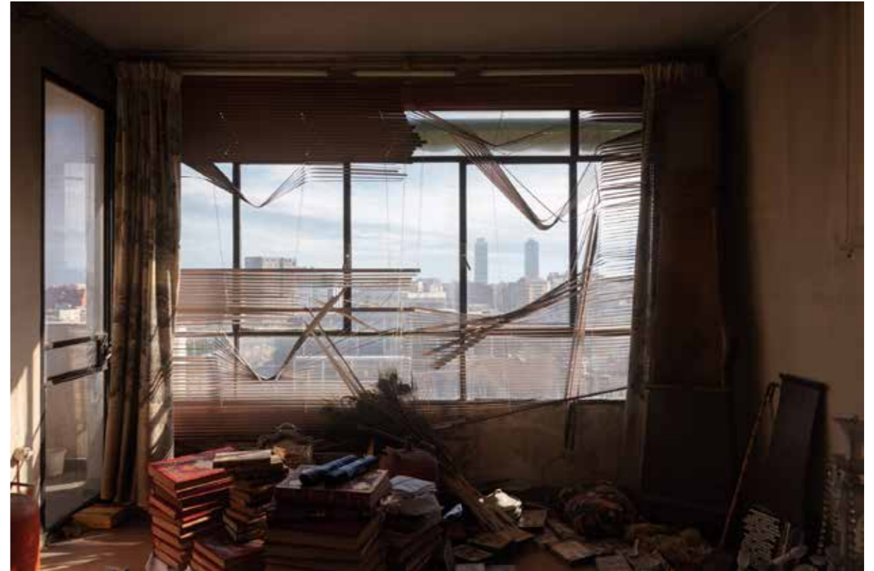
Gran Via, 798. Paper Giclée Photo Rag baryta montat en Forex / Giclée Photo Rag baryta paper mounted on Forex, 100 x 66,6 cm.

Publicat per / Published by Artur Ramon Art. Bailèn 19, 08010 Barcelona Disseny gràfic / Graphic design Mariona Garcia Coordinació / Coordination: Mònica Ramon Traducció / Translation: Julia Wells