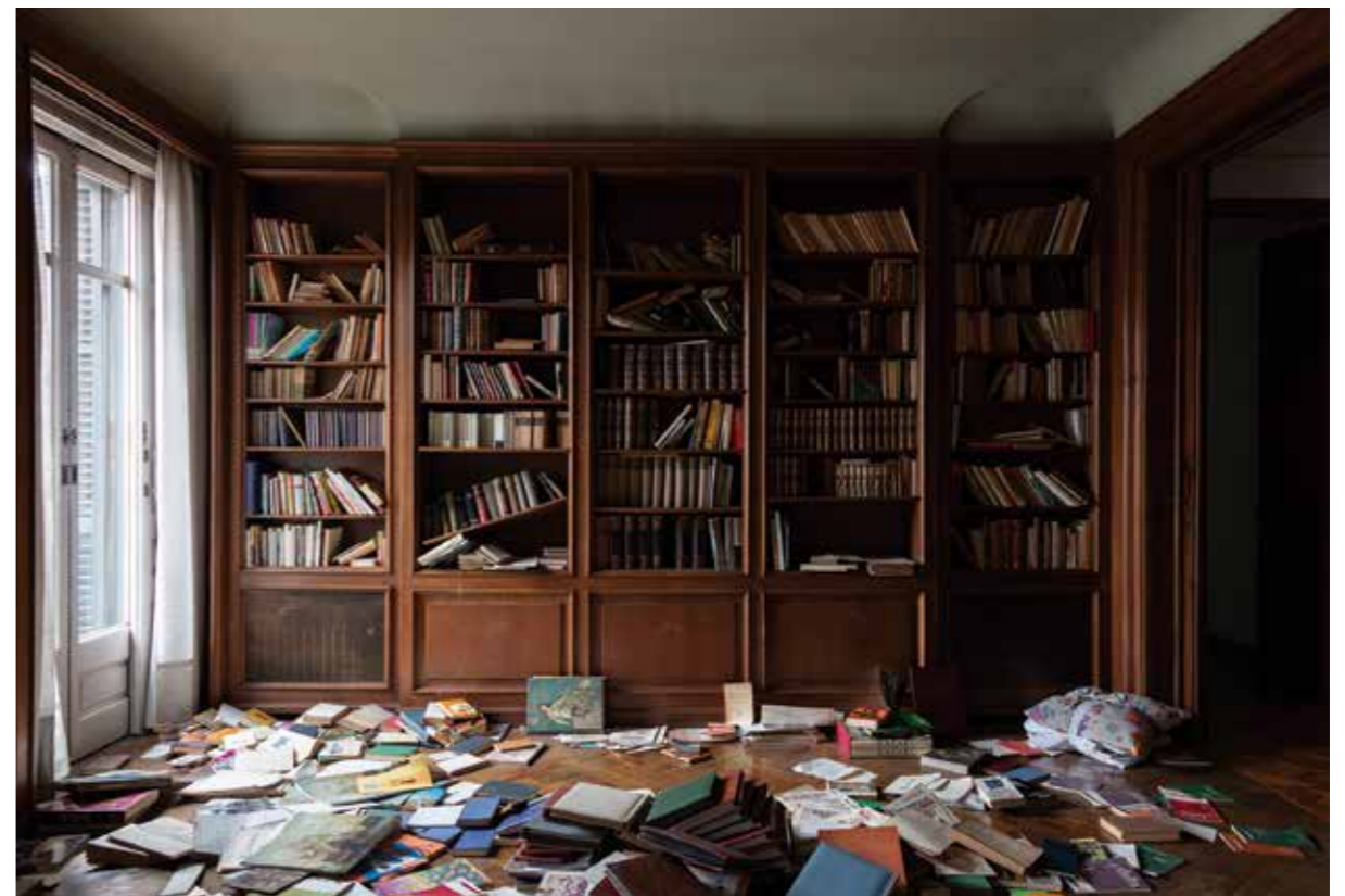
Diagonal, 363. Paper Giclée Photo Rag baryta montat en Forex / Giclée Photo Rag baryta paper mounted on Forex, 100 x 66,6 cm.