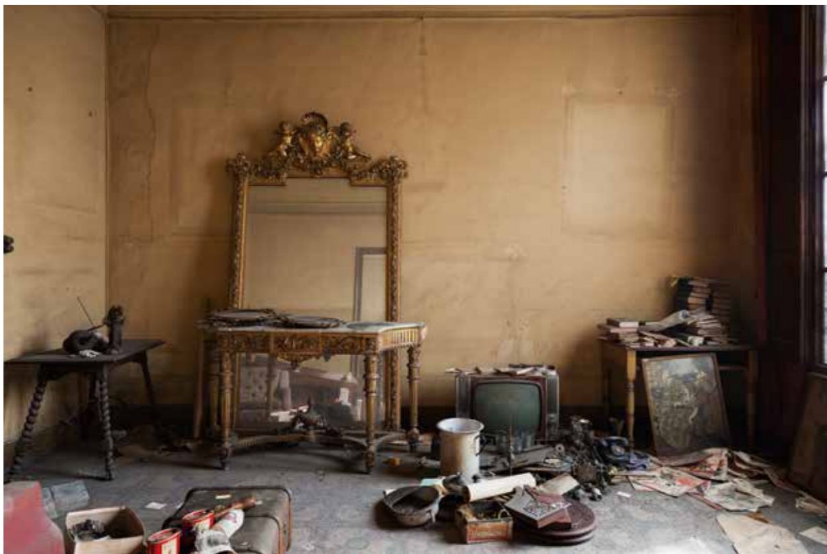
Rambla, 102. Paper Giclée Photo Rag baryta montat en Forex / Giclée Photo Rag baryta paper mounted on Forex, 100 x 66,6 cm.