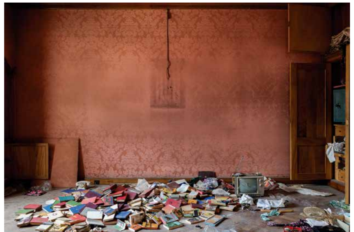
Passeig de Gràcia, 93. Paper Giclée Photo Rag baryta montat en Forex / Giclée Photo Rag baryta paper mounted on Forex, 100 x 66,6 cm.