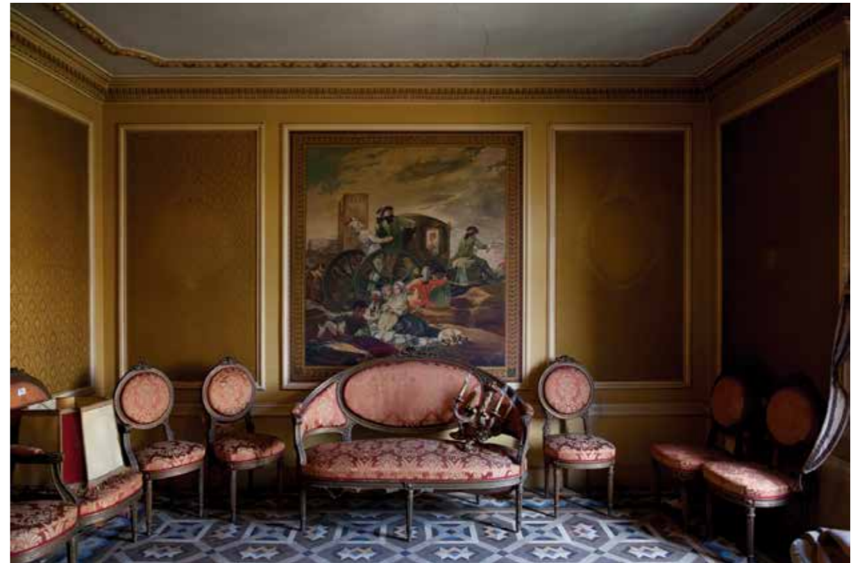
Gran Via, 658. Paper Giclée Photo Rag baryta montat en Forex / Giclée Photo Rag baryta paper mounted on Forex, 100 x 66,6 cm.

The author, acting as a sort of Archaeologist of Interiors , for the past twenty years has been photographically documenting all of these flats in the city of Barcelona with the purpose of rescuing them instants before they disappear. These are ephemeral landscapes, often desolate ones, with personal mementos strewn on the floor, clothes, books, documents... and it in these instants of change, of movement, is when these photographs are taken. Fleetingly, while the operatives and movers break down beds, light fixtures, drag and pack furniture that surely nobody had moved from its place in over eighty years.