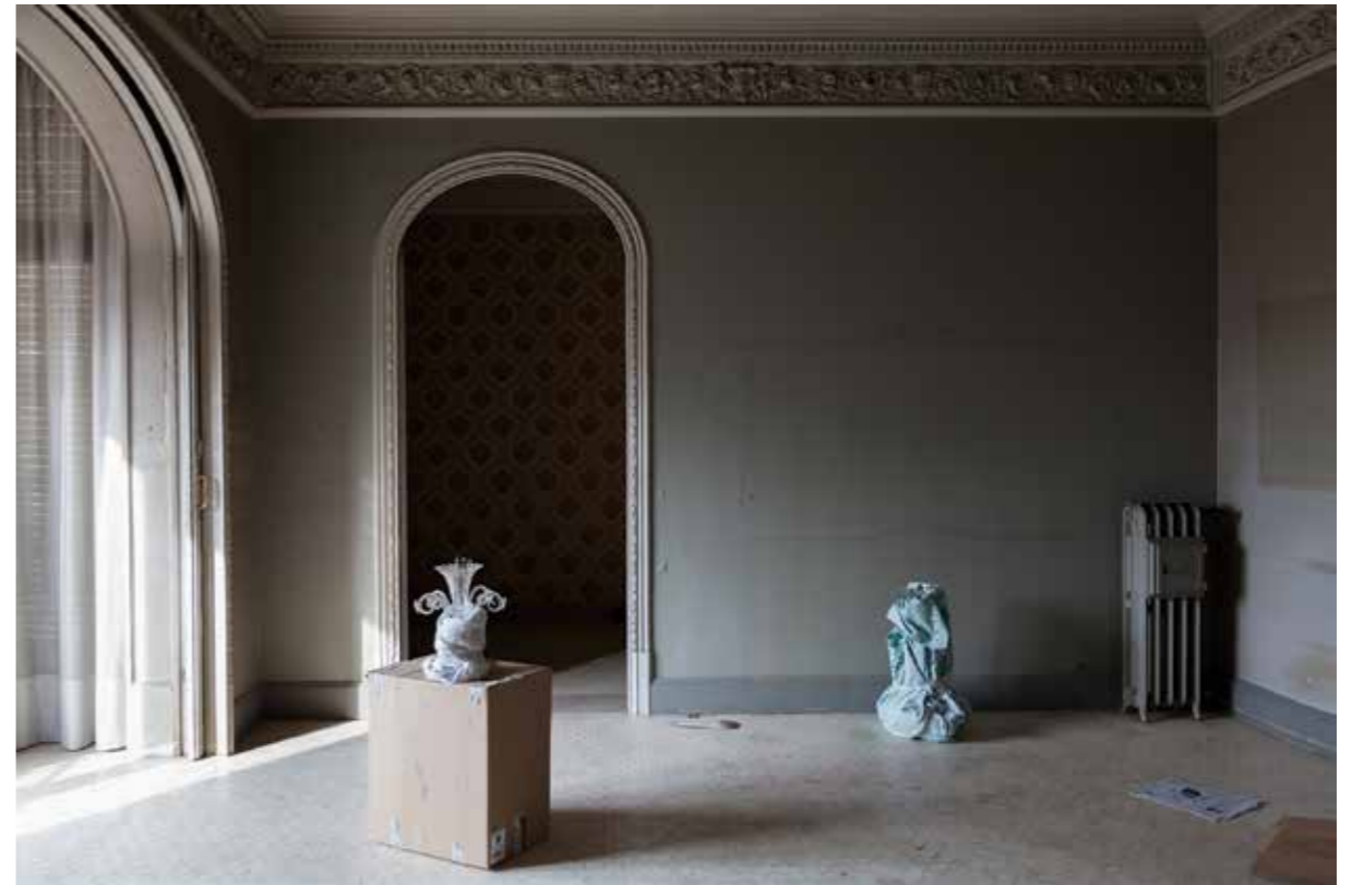
Rambla Catalunya, 135. Paper Giclée Photo Rag baryta montat en Forex / Giclée Photo Rag baryta paper mounted on Forex, 100 x 66,6 cm.